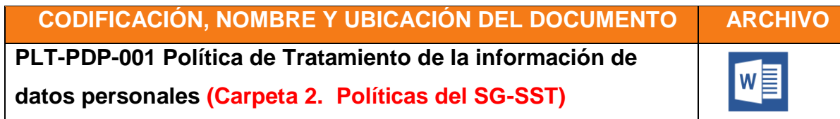
Tabla 2. Políticas Tratamiento de la información de datos personales

La política es revisada periódicamente por el representante legal y ante cualquier cambio sustancial en las políticas de tratamiento, en los términos descritos en el artículo 5° del decreto 1377, deberá ser comunicado oportunamente a los titulares de los datos personales de una manera eficiente, antes de implementar las nuevas políticas.